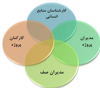
شکل ۱. چهاروجهی منابع انسانی بردین و سودرلوند، ۲۰۱۱

۱. مدیران صف: در ادبیات اخیر، به مدیران صف به عنوان بازیگران مهم اشاره شده است که مسئولیت ارزش‌آفرینی منابع انسانی در سازمان را عهده دارند.