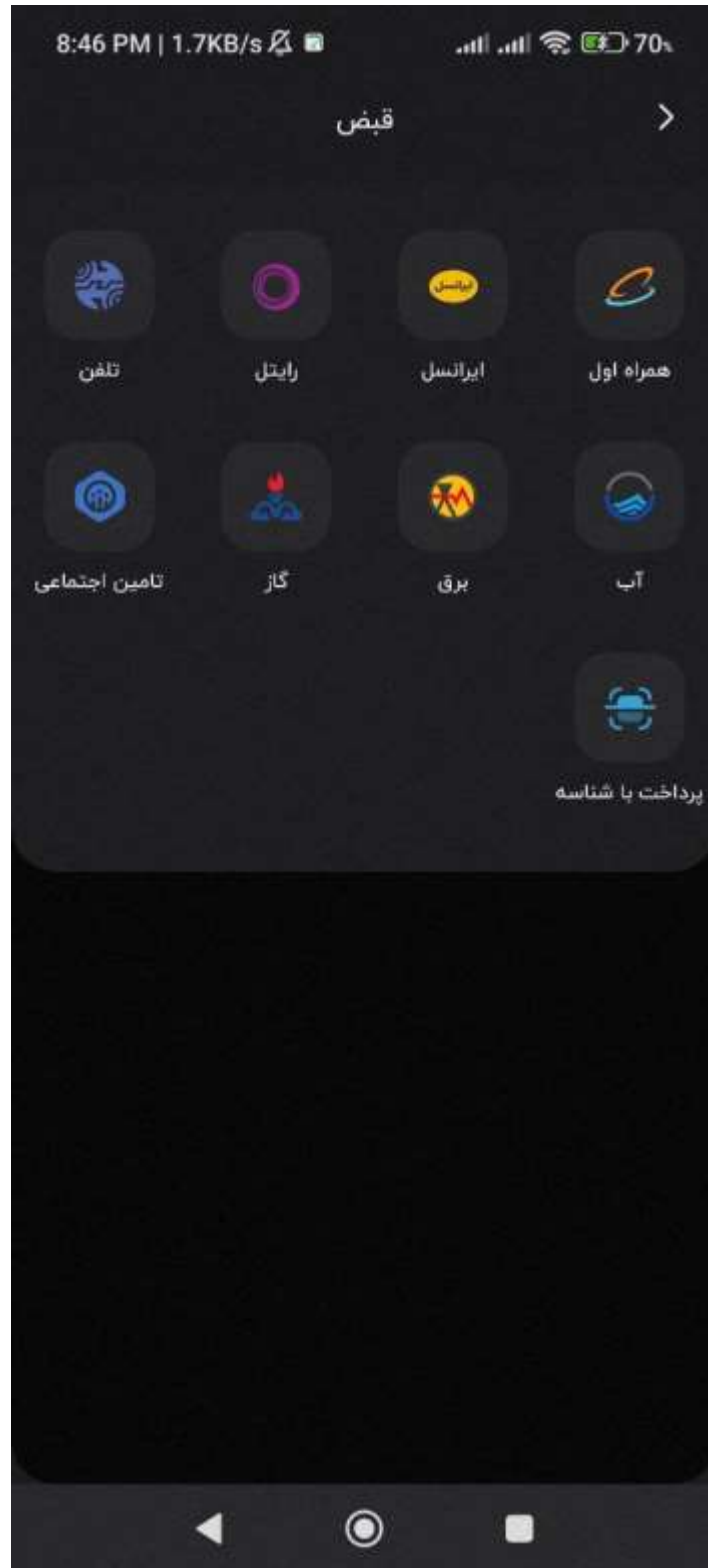
شکل ۲- صفحه انتخاب سرویس (خرید شارژ یا قبض تلفن ثابت)