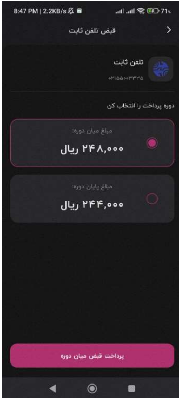
شکل ۴- صفحه نمایش نتیجه استعلام بدهی خط تلفن ثابت