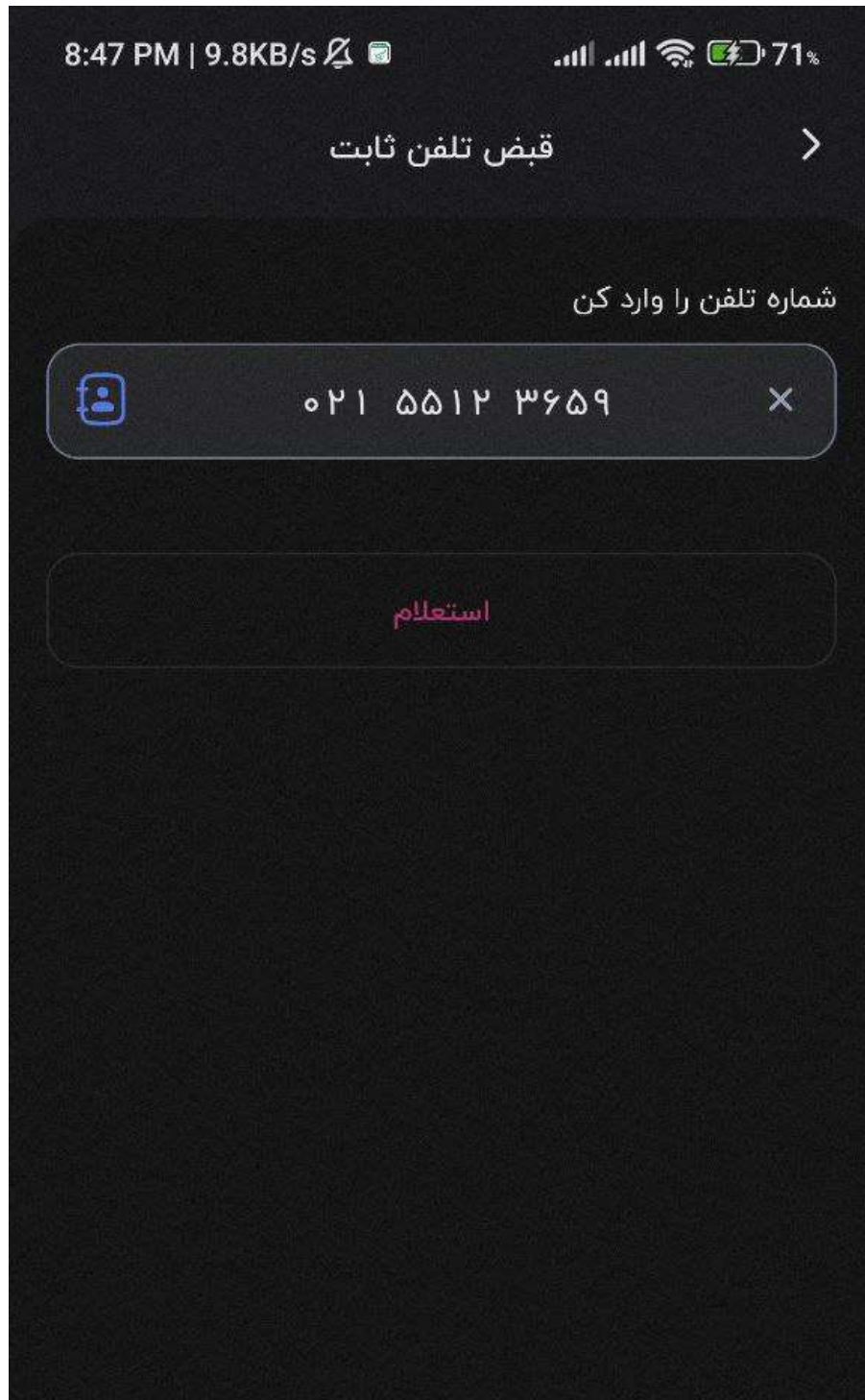
شکل ۳ - صفحه ورود تلفن ثابت جهت استعلام