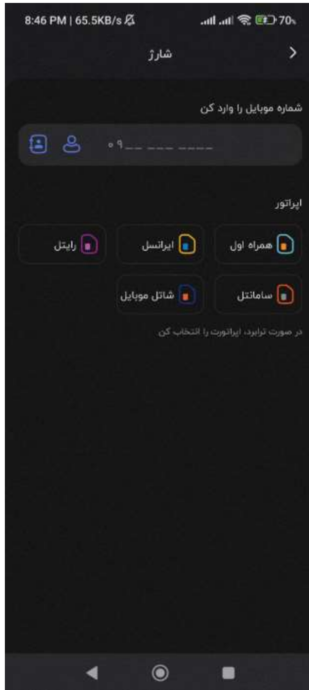
شکل ۵- صفحه وارد کردن شماره موبایل + نام اپراتور برای خرید شارژ