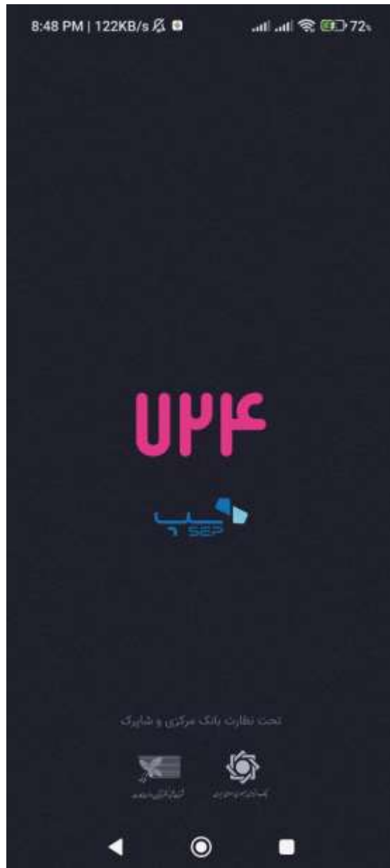
شکل ۱ - نمونه پیشنهادی صفحه آغازین Splash Screen