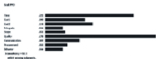
شکل ۵. مقایسه‌های زوجی بین سنجه‌ها (درجه اهمیت)

پس از تعیین معیارها (ابعاد) پرسشنامه‌ای تهیه شد. این پرسشنامه بین ۱۲ نفر از خبرگان توزیع گردید. البته بر اساس تجزیه و تحلیل‌های فرآیند سلسله مراتبی، حداکثر تعداد نظرسنجی‌ها بر اساس تعداد معیارها و گزینه‌ها، ۷ عدد می‌باشد که تعداد ۱۲ پرسشنامه، جامعیت نظرات را اعلام می‌دارد. نمودار ۴-۴ گویای نتایج مقایسه‌های زوجی می‌باشد که خبرگان انجام داده‌اند. بر اساس محاسبات صورت گرفته در مورد آلفای کرونباخ (جهت بررسی روایی پژوهش) این مقدار ۰.۸۵۹، بدست آمد که می‌توان ادعا نمود صحت نمونه‌گیری‌های انجام شده حدود ۷۴ درصد می‌باشد.