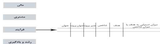
شکل ۱. الگوی کارت امتیازی متوازن

BSC یک الگو و یا به عبارتی یک چارچوب مفهومی برای تدوین مجموعه‌ای از شاخص‌های عملکرد در جهت اهداف استراتژیک است و در اولین گام آن باید دیدگاه آتی سازمان مشخص شود. سپس با توجه به دیدگاه حاکم بر سازمان، اهداف استراتژیک تدوین می‌شوند و یا باید تدوین شده باشند. با عنایت به دیدگاه آتی و اهداف استراتژیک سازمان، عوامل بحرانی موفقیت ۲ مشخص می‌شوند. به همین ترتیب معیارهای استراتژیک تبیین و در نهایت برنامه اقدام تدوین می‌شود. قابل ذکر است که الگوی BSC یکی از موفق‌ترین الگوهای مورد استفاده در زمینه ارزیابی عملکرد قلمداد می‌شود. شکل ۱ این موضوع را بیشتر شرح می‌دهد[۱]