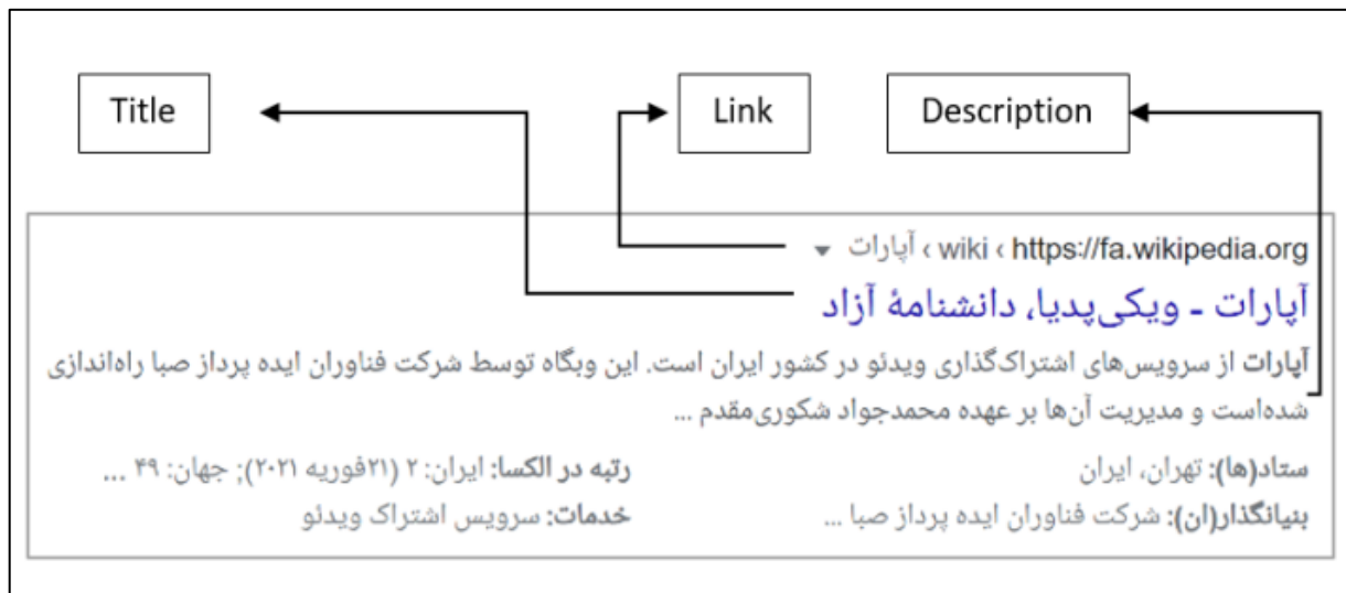
شکل (۲): نمونه یک جستجو